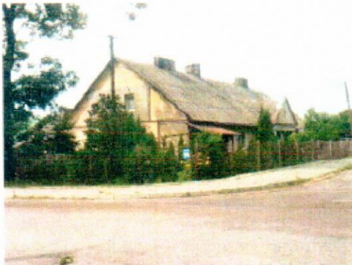
Widok od strony skrzyżowania