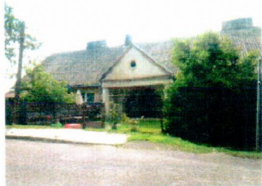
Wejście do budynku