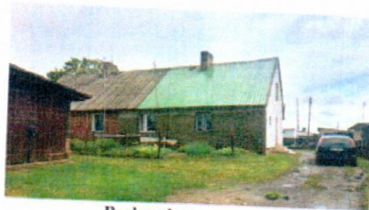
Budynek z zewnątrz