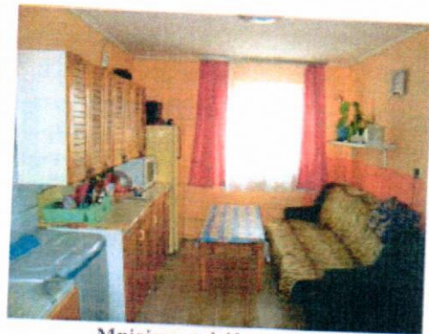
Mniejszy pokój z aneksem